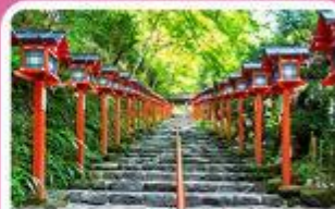
ศาลเจ้าคิฟูเนะ