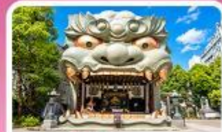
ศาลเจ้านิมมะ ยาซากะ