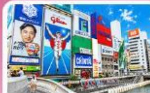
ชิบโซบาชิ