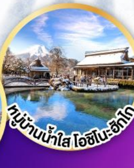
หมู่บ้านน้ำใส ไอชิโนะ-ซึกาโ