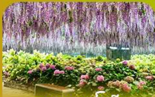
สวนนกเปาเม็ย