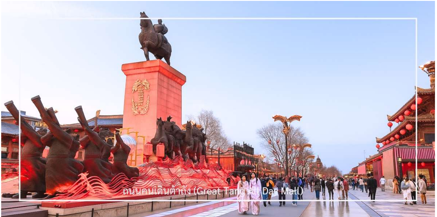
ถนนคนเดินต้าถั่ง (Great Tang All Day Mall)

นำท่านเดินทางสู่ ถนนคนเดินต้าถั่ง (Great Tang All Day Mall) แลนด์มาร์คยอดนิยมของเมืองซีอาน ตั้งอยู่บริเวณตรงข้ามกับ เจดีย์ห่านป่าใหญ่ ถนนสายนี้ถูกออกแบบให้มีกลิ่นอายของเมืองฉางอันในสมัยราชวงศ์ถัง ตลอดสองฝั่งเรียงรายด้วยอาคารสไตล์จีน ร้านค้า ร้านอาหาร คาเฟ่ และมุมถ่ายรูปมากมาย ในช่วงค่ำจะมีการแสดงตามจุดต่าง ๆ ตลอดแนวถนน ทั้งการแสดงดนตรี การรำแบบจีน และโชว์แสงสีที่ช่วยเพิ่มความคึกคักให้กับบรรยากาศยามค่ำคืน หรือจะเช่าชุด ฮั่นฝู แต่งตัวถ่ายรูป เดินเล่นภายในถนนคนเดิน ให้ความรู้สึกเหมือนได้ย้อนเวลากลับไปในยุคราชวงศ์ถังอีกครั้ง