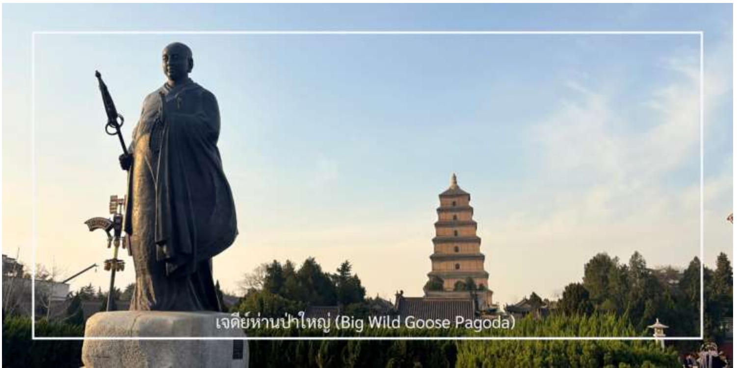
เจดีย์ห่านป่าใหญ่ (Big Wild Goose Pagoda)

นำท่านเดินทางสู่ ถนนคนเดินต้าถั่ง (Great Tang All Day Mall) แลนด์มาร์คยอดนิยมของเมืองซีอาน ตั้งอยู่บริเวณตรงข้ามกับ เจดีย์ห่านป่าใหญ่ ถนนสายนี้ถูกออกแบบให้มีกลิ่นอายของเมืองฉางอันในสมัยราชวงศ์ถัง ตลอดสองฝั่งเรียงรายด้วยอาคารสไตล์จีน ร้านค้า ร้านอาหาร คาเฟ่ และมุมถ่ายรูปมากมาย ในช่วงค่ำจะมีการแสดงตามจุดต่าง ๆ ตลอดแนวถนน ทั้งการแสดงดนตรี การรำแบบจีน และโชว์แสงสีที่ช่วยเพิ่มความคึกคักให้กับบรรยากาศยามค่ำคืน หรือจะเช่าชุด ฮั่นฝู แต่งตัวถ่ายรูป เดินเล่นภายในถนนคนเดิน ให้ความรู้สึกเหมือนได้ย้อนเวลากลับไปในยุคราชวงศ์ถังอีกครั้ง