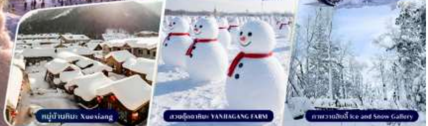
หมู่บ้านหิมะ Xuexiang