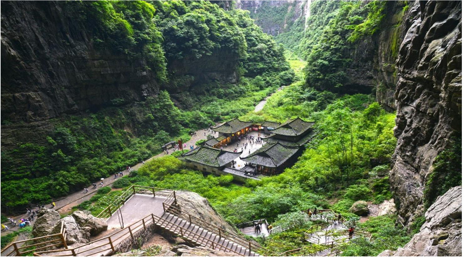
กลางวัน รับประทานอาหารกลางวัน ณ ภัตตาคาร (เมื่อที่ 3)

ในกรณีที่อุทยานฯ มีประกาศปิดบริการลิฟต์แก้วชั่วคราว หรือปิดกระเบื้องกระจก ไม่ว่าจะด้วยเหตุผลด้านการซ่อมบำรุงหรือจากสภาพอากาศที่ไม่อำนวย บริษัทฯ คำนึงถึงความปลอดภัยของท่านเป็นสำคัญที่สุด จึงขอสงวนสิทธิ์ในการปรับเปลี่ยนโปรแกรมการท่องเที่ยวให้เหมาะสมกับสถานการณ์ โดยอาจจัดหาโปรแกรมอื่นมาทดแทน ทั้งนี้ การเปลี่ยนแปลงดังกล่าวอยู่นอกเหนือการควบคุมของบริษัทฯ จึงไม่สามารถคืนเงินค่าบริการในส่วนนี้ได้ โดยบริษัทฯ จะยึดตามประกาศจากทางอุทยานฯ เป็นสำคัญ