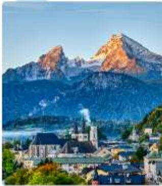
ออสเตรียบาวาเรียดินแดนแห่งเทพนิยาย