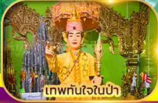
เทพทันใจในป่า