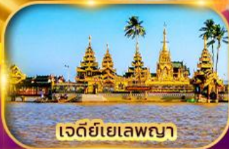
เจดีย์เยเลพญา