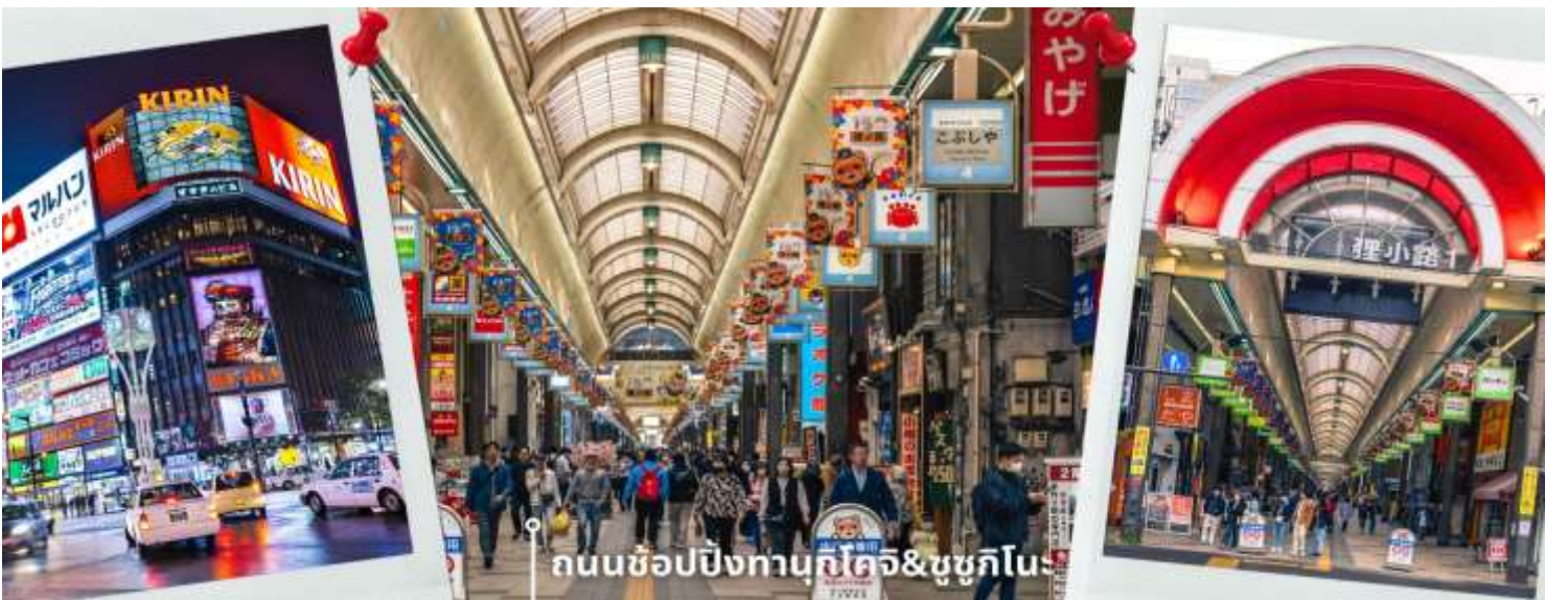
ถนนช้อปปิ้งทานุกิโคจิ&ชูชุกิโนะ

หลังรับประทานอาหารเที่ยง นำท่านเดินทางสู่ DUTY FREE ให้ท่านได้ช้อปปิ้งสินค้าปลอดภาษี เครื่องสำอาง ของใช้ ก่อนจะพาท่านเดินทาง ถนนช้อปปิ้งทานุกิโคจิ เป็นถนนช้อปปิ้งที่ตั้งอยู่แทบจะใจกลางเมือง Sapporo โดยมีร้านค้า ร้านอาหาร ห้างสรรพสินค้า ร้านเกม และโรงแรม รวมกันมากกว่า 200 เรียงรายยาวตั้งแต่ทิศตะวันตก ยันทิศตะวันออกยาวถึง 1 กิโลเมตร และยังมีบันไดเลื่อนลงไปทางเดินใต้ดินอีกด้วย ซึ่งทางเดินใต้ดินก็ยังมีร้านค้า ร้านอาหารอีกมากมายด้วยเช่นกัน ถนนช้อปปิ้งแห่งนี้เป็นที่ที่หลังจากแทบจะตลอดทาง ดังนั้นแล้วไม่ว่าจะฝนตก