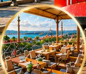
Seven Hills Cafe ชมวิว อิสตันบูล