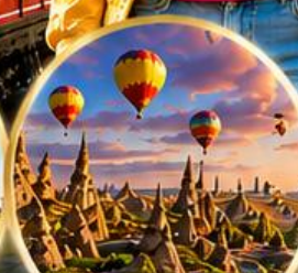
เมืองคัปปาโดเกีย Cappadocia