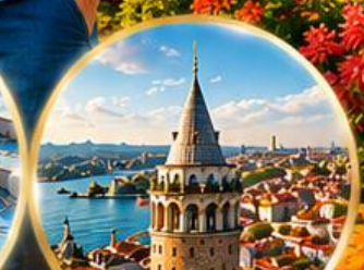
หอคอยกาลาตา Galata Tower