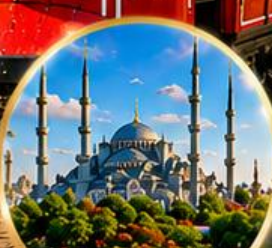
สุเหร่าสีน้ำเงิน Blue Mosque