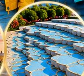
ปามุกคาล์ Pamukkale