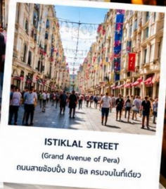
ISTIKLAL STREET (Grand Avenue of Pera) ถนนสายช้อปปิ้ง ยืน อิล ครอบคลุมพื้นที่เดียว