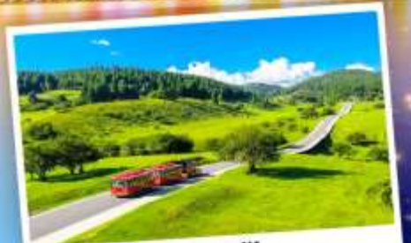
เจานางฟ้า