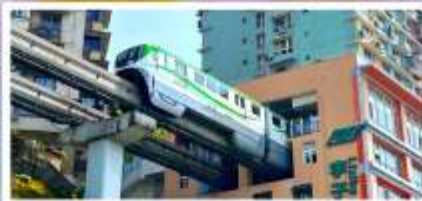
รถไฟฟ้าลัดติง