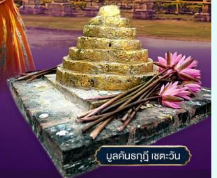
มูลคันธกุฎี เขตเววัน