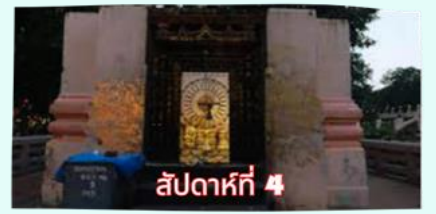
รัตนขรรเจดีย์ (ซุ้มเรือนแก้ว)

เรียบร้อยแล้ว นำคณะจาริกบุญสวดมนต์ทำวัตรเย็น บูชาพระรัตนตรัย และสวดมนต์บูชาสังเวชนียสถาน จากนั้นเชิญท่านทัศนารธรรม นั่งสมาธิปฏิบัติบูชาตามอัยาศัย สมควรแก่เวลา นัดหมายเวลาเชิญท่านกลับโรงแรมที่พัก