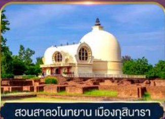
สวนสาละวินทโยน เมืองกุสินารา