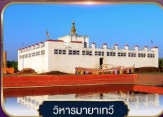
วิหารมายาเทวี