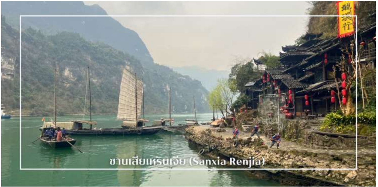
ซาบเสี่ยเหรินเจีย (Sanxia Renjia)

พร้อมให้ท่านได้ชมการแสดงเรื่องราวเกี่ยวกับวิถีชีวิตควบคู่กับสายน้ำ การแสดงในครั้งนี้จะถ่ายทอดเรื่องราวความเป็นอยู่ ความเชื่อ และประเพณีของผู้คนในชุมชน ผ่านศิลปะการแสดงที่ผสมผสานความอ่อนช้อยและควมมีชีวิตชีวา