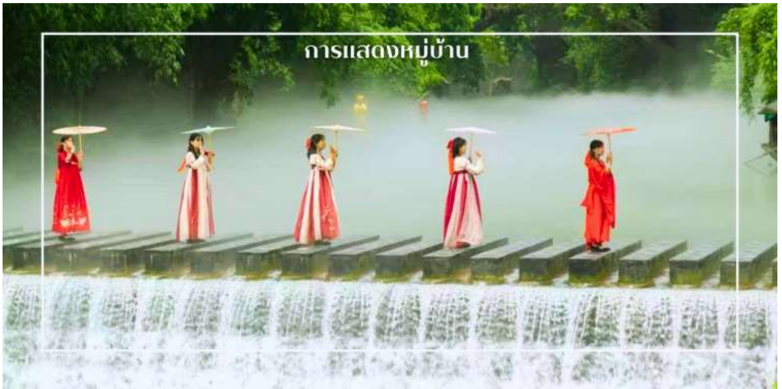
การแสดงหมู่บ้าน

พร้อมให้ท่านได้ชมการแสดงเรื่องราวเกี่ยวกับวิถีชีวิตควบคู่กับสายน้ำ การแสดงในครั้งนี้จะถ่ายทอดเรื่องราวความเป็นอยู่ ความเชื่อ และประเพณีของผู้คนในชุมชน ผ่านศิลปะการแสดงที่ผสมผสานความอ่อนช้อยและควมมีชีวิตชีวา