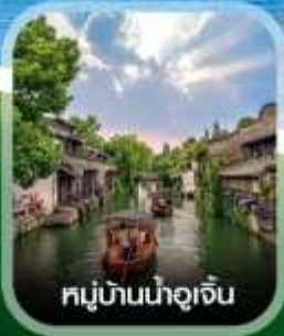
หมู่บ้านน้ำจู้เจิน