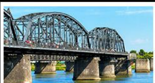
สะพานหวาดถานตง

2 มหัศจรรย์ธรรมชาติระดับโลก "หาดแดงผานจิน" คู่กับ "ถ้ำน้ำเป็นสี" ยืนมองฝั่งเกาหลีเหนือที่ตามอง • ชมความยิ่งใหญ่ของพระราชวังเส้นหยางกู่กิง