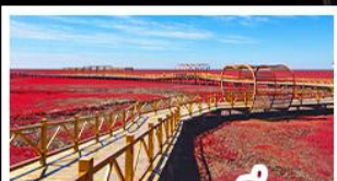
หาดแดงผานจิน