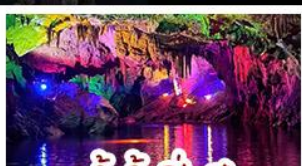
ถ้ำน้ำเป็นสี