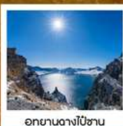
อุทยานดางไป่ซาน