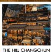
THE HILL CHANGCHUN