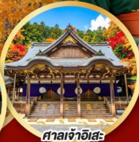
ศาลเจ้าฮิสะ