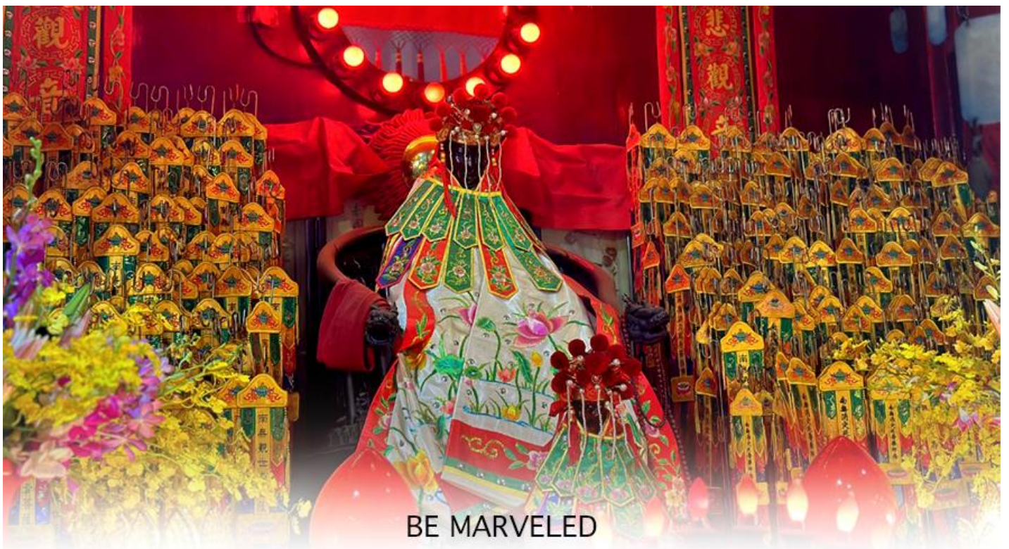
BE MARVELED วัดเจ้าแม่กวนอิมฮองอำ (ยิมฮิน)

ให้เดินทางกลับไปกราบไหว้ และขอบคุณเจ้าแม่กวนอิมอีกครั้ง โดยเตรียมชุดไหว้และกระดาษเงินกระดาษทอง ที่เป็นเหมือนเงินที่เรานำมาคืน เป็นการไหว้เพื่อคืนเงินเจ้าแม่กวนอิมนั่นเอง