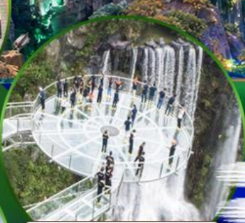
สะพานแก้วคู่หลงเซี่ยะ