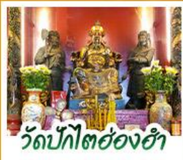
วัดปึกโตย่องฮา