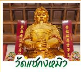
วัดเซกตงหิว