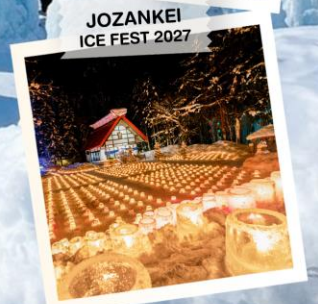
JOZANKEI ICE FEST 2027

วันเดินทาง 27 ม.ค. - 1 ก.พ. 2570 29 ม.ค. - 3 ก.พ. 2570