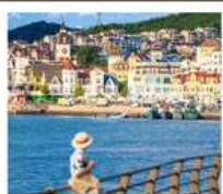
อ่าวหลงเจียง

หาดโซเบอร์ NO.3 • ถนนหลงเจียง • Silver Fish St. • ย่านปาต้ากอน โรงงานเบียร์ชิงเต่า • ถนนคนเดินไถ่ตง • สะพานจ้านเตียว • ถนนจงซาน โบสถ์ St. Emil • คาเฟ่ RIVI Lounge • มังกรข้ามสะพานทะเลชิงไห่ พิพิธภัณฑ์ลวิ่ซุ่น • อาคารกองบัญชาการกองทัพแดง • หอคอยแห่งชัยชนะ สถานีรถไฟลวิ่ซุ่น • ถนนญี่ปุ่น • ถนนตงกวน • Fisherman's Wharf ย่านประวัติศาสตร์และวัฒนธรรมตงกวน • จตุรัสชิงไห่ (รวมรถราง) จตุรัส 54 • อ่าวหลงเจียง • มังกรรางเมืองต้าเหลียน ถนนริสเซีย • สวนตงกั๊ง • เมืองเวนิสแห่งต้าเหลียน • ห้าง MIX C