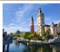
เมืองเวนิสแห่งต้าเหลียน