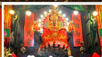
วัดเซกตงเหมียว