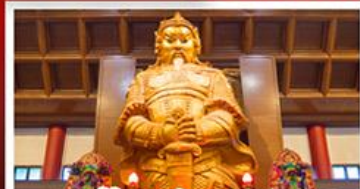
วัดแซกงหมิว