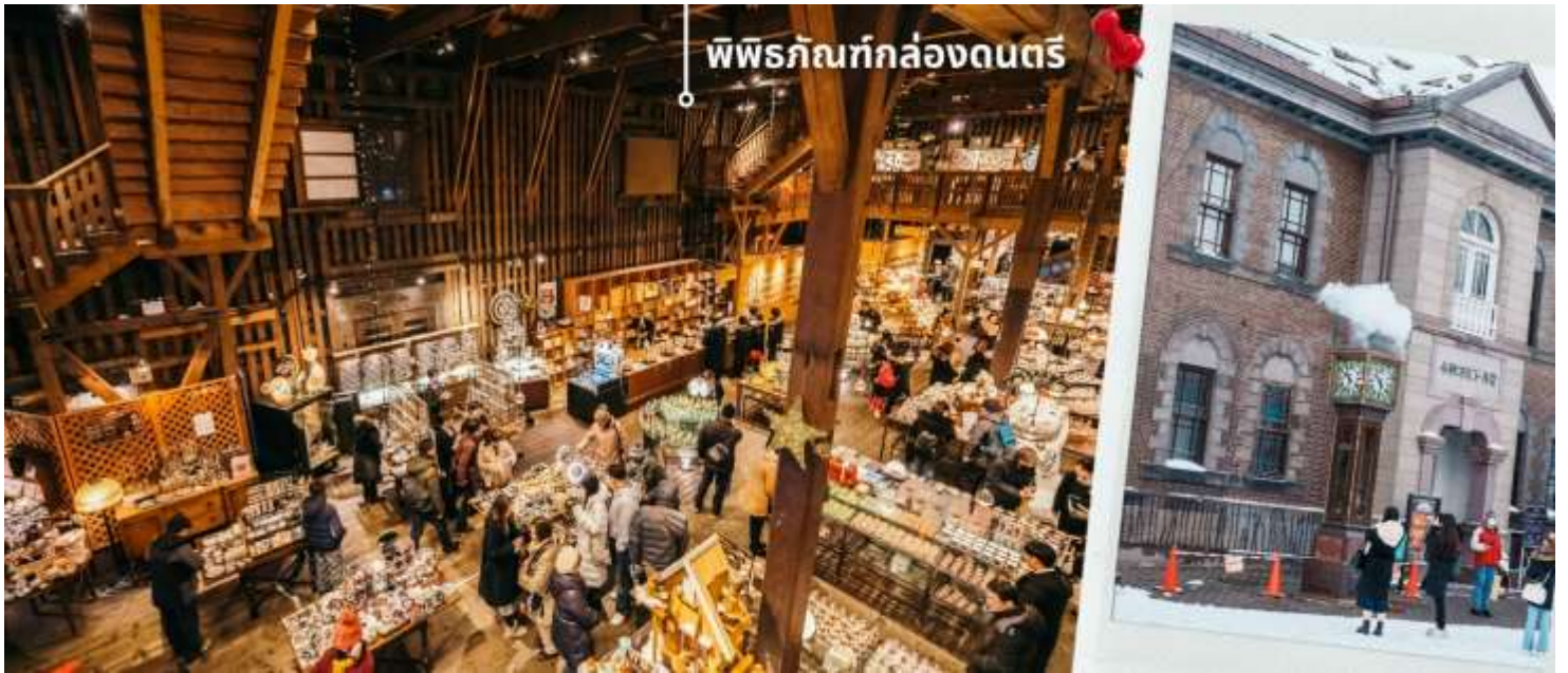
พิพิธภัณฑน์กล่องดนตรี

จากนั้นให้ท่านได้ชม หอนาฬิกาไอน้ำ ซึ่งตั้งอยู่ด้านหน้าพิพิธภัณฑน์ เป็นหอนาฬิกาขนาดใหญ่ที่รัฐบาลแคนาดามอบให้เป็นของขวัญแก่ประเทศญี่ปุ่น หอนาฬิกาแห่งนี้ ถูกตั้งเวลาให้ส่งเสียงออกมาทุกๆ15นาที และพ่นไอน้ำออกมาทุกๆชั่วโมง เหมือนเป็นจุดเช็คอินอีก1จุดของเมืองแห่งนี้ที่พลาดไม่ได้ จากนั้นให้ท่านได้ชม พิพิธภัณฑน์กล่องดนตรี ด้านในของพิพิธภัณฑน์มีพื้นที่กว้าง เป็นพิพิธภัณฑน์ที่มีเสน่ห์และเอกลักษณ์มากที่สุดอีกแห่งหนึ่งในญี่ปุ่น โดยพิพิธภัณฑน์แห่งนี้ตั้งอยู่ภายในอาคารอิฐเก่าแก่สูง 3 ชั้น ที่เดิมเคยเป็นโกดังเก่าแต่ถูกปรับปรุงจนกลายมาเป็นพิพิธภัณฑน์ ภายในเป็นสถานที่เก็บคอลเลคชั่นกล่องดนตรีที่ใหญ่ที่สุดแห่งหนึ่งของโลก ที่มีทั้งงานโบราณและงานร่วมสมัยใหม่ของยุโรป ญี่ปุ่น เก็บสะสมอยู่มากมาย มีทั้งขนาดเล็กและขนาดใหญ่นอกจากนี้ด้านในยังมีช่วงที่ เปิดโอกาสให้ผู้เยี่ยมชมสามารถทำกล่องดนตรีของตัวเองได้ ทั้งเลือกรูปแบบและการเลือกเมโลดี้เพลง เพื่อสร้างผลงานของตัวเองที่มีชิ้นเดียวในโลก และยังมีร้านค้าสำหรับขายกล่องดนตรีเพื่อซื้อเป็นของฝาก ของที่ระลึกได้อีกด้วย