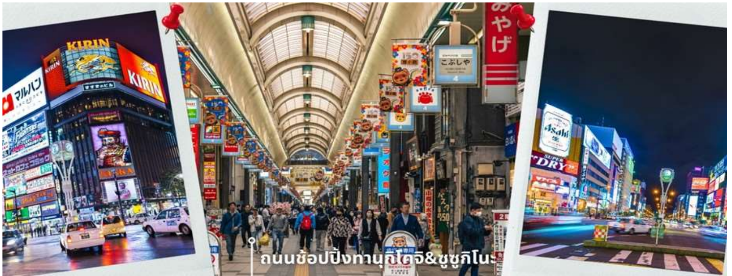
ถนนช้อปปิ้งทานุกิโคจิ&ชูชุกิโนะ

รายล้อมด้วยภูเขาและป่าสนที่ปกคลุมด้วยหิมะขาวโพลน กิจกรรมนี้ถือเป็นอีกหนึ่งเสน่ห์ของการท่องเที่ยวฤดูหนาวที่ผสมผสานทั้งความสุข ความตื่นเต้น และบรรยากาศสุดพิเศษไว้ในช่วงเวลาเดียวกัน เหมาะสำหรับผู้ที่ต้องการสัมผัสประสบการณ์ใหม่ ๆ พร้อมเก็บภาพความประทับใจท่ามกลางวิวหิมะสุดอลังการ พอสมควรแก่เวลา นำท่านเดินทางสู่ ถนนช้อปปิ้งทานุกิโคจิ เป็นถนนช้อปปิ้งที่ตั้งอยู่แทบจะใจกลางเมือง Sapporo โดยมีร้านค้า ร้านอาหาร ห้างสรรพสินค้า ร้านเกม และโรงแรม รวมกันมากกว่า 200 เรียงรายยาวตั้งแต่ทิศตะวันตกยันทิศตะวันออกยาวถึง 1 กิโลเมตร และยังมีบันไดเลื่อนลงไปทางเดินใต้ดินอีกด้วย ซึ่งทางเดินใต้ดินก็ยังมีร้านค้า ร้านอาหารอีกมากมายด้วยเช่นกัน ถนนช้อปปิ้งแห่งนี้เป็นที่มาของหิมะที่ตกลงมาตลอดทาง ดังนั้นแล้วไม่ว่าจะฝนตก หิมะตก หรือแดดแรง ก็ยังสามารถเดินช้อปปิ้งที่ถนนแห่งนี้ได้เหมือนเดิม และย่านชูชุกิโนะ เป็นย่านช้อปปิ้งและบันเทิงใหญ่ที่สุดในซัปโปโร ตั้งอยู่ใจกลางเมืองและตั้งอยู่บริเวณรอบๆสถานีรถไฟใต้ดินชูชุกิโนะ อยู่ห่างไปไม่กี่กิโลจากสวนสาธารณะโอโดริประมาณ 500เมตรและอยู่ไม่ไกลจากถนนทานุกิโคจิ ย่านนี้เป็นที่นิยมของทั้งคนท้องถิ่นและนักท่องเที่ยว ย่านนี้เต็มไปด้วยร้านค้ามากมาย ทั้งสินค้าแฟชั่น สินค้าแบรนด์เนม ของฝาก ของที่ระลึก และสินค้าอุปโภคบริโภคต่างๆ รวมถึงสถานบันเทิงยามค่ำคืน ให้เวลาท่านได้เดินช้อปปิ้งตามอัธยาศัย