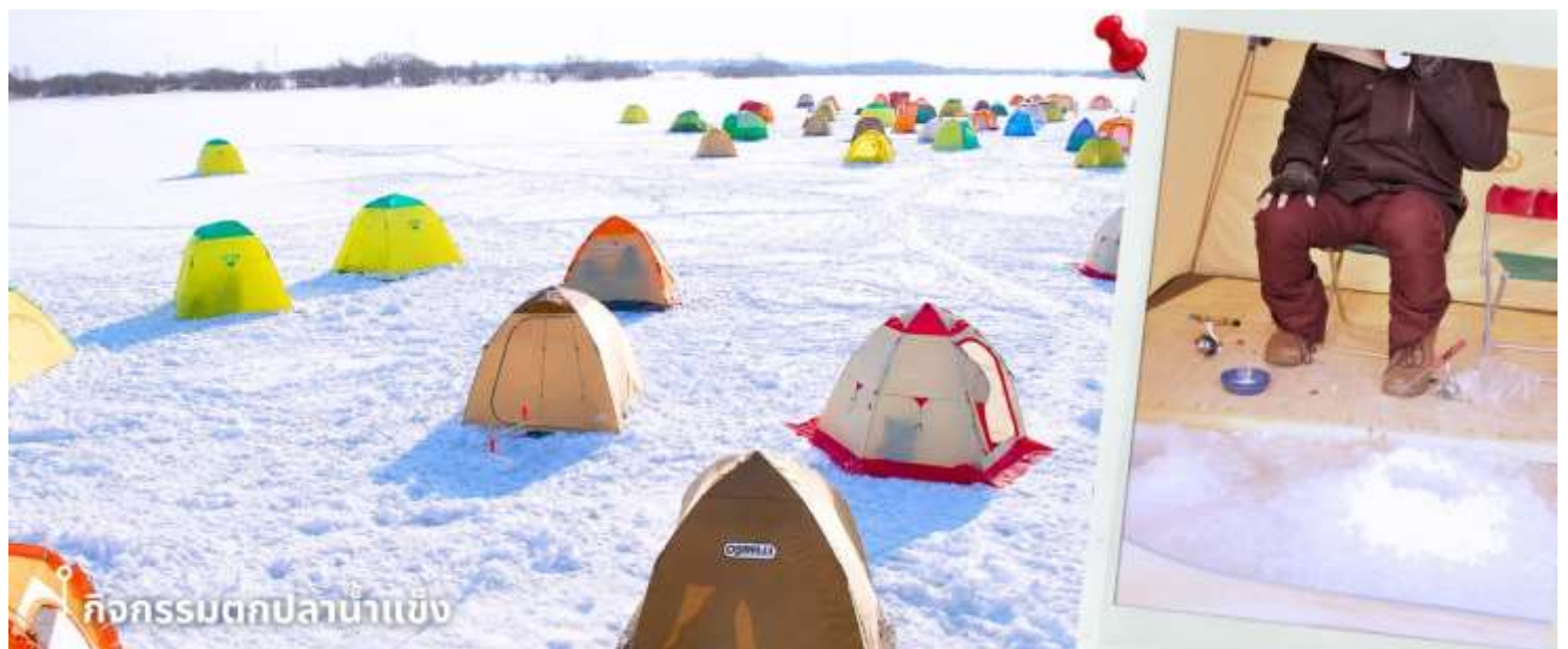
กิจกรรมตกปลาน้ำแข็ง

หลังรับประทานอาหารเที่ยง พาท่านทำกิจกรรมสุดฮิต กับ กิจกรรมตกปลาน้ำแข็ง (รวมค่าอุปกรณ์ตกปลา) กิจกรรมฤดูหนาวยอดนิยมของญี่ปุ่น กับการตกปลาน้ำแข็งท่ามกลางบรรยากาศธรรมชาติที่ปกคลุมด้วยหิมะสีขาว โดยในช่วงฤดูหนาว ผิวน้ำของทะเลสาบจะกลายเป็นแผ่นน้ำแข็งขนาดใหญ่ เปิดโอกาสให้นักท่องเที่ยวได้สัมผัสประสบการณ์ตกปลากลางอากาศหนาวแบบดั้งเดิมของญี่ปุ่น ท่ามกลางบรรยากาศหิมะสีขาวและอากาศหนาวเย็นแบบญี่ปุ่นแท้ ๆ ท่านจะได้ลองตกปลาด้วยตัวเองบนผืนน้ำแข็งขนาดใหญ่ พร้อมดื่มด่ำกับวิวธรรมชาติอันเงียบสงบ