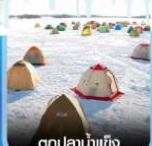
ตกปลาน้ำแข็ง