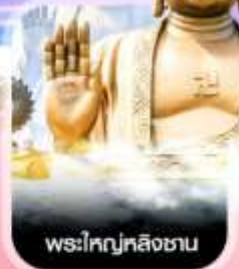
พระใหญ่หลังชาน