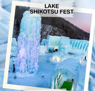
LAKE SHIKOTSU FEST