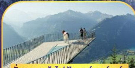
นั่งรถกระเช้าไฟฟ้า ฮาร์เตอร์ คูล์ม