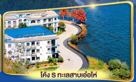
โค้ง S ทะเลสาบเอ่อไห่