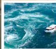
คลองเรือขมบ้านนาสุโตะ

คลองเรือขมบ้านนาสุโตะ / ซุปบึงย่านชินโซบาชิ / ตลาดปลาคุโรเมง / ซุปบึงย่านอุมาเดะ