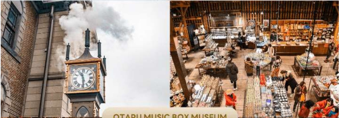
OTARU MUSIC BOX MUSEUM