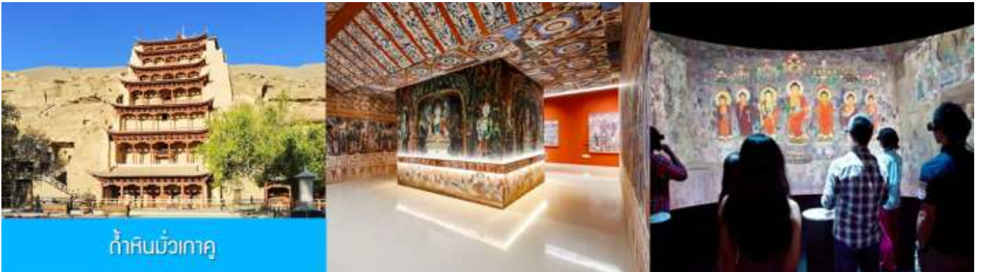
ถ้ำหินมั่วเกา

เช้า รับประทานอาหารเช้า ณ ห้องอาหารของโรงแรม (1)