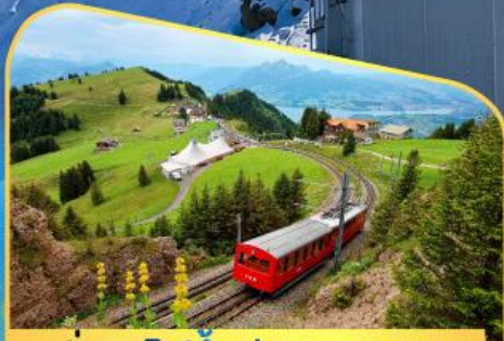
นั่งรถไฟขึ้นสู่ยอดเขาโรทิก