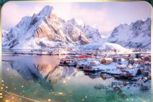
หมู่บ้านเรเนน