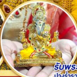
รับพระพิฆเนศวร ปางรำรอย ท่านละ 1 องค์