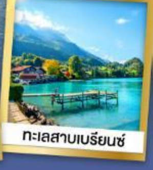
ทะเลสาบเบรีนซ์